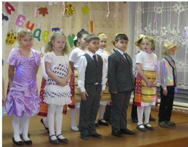
Концерт «От всей души»